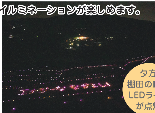
夕方 棚田の畔の LEDライト が点灯

お米作りをしている田んぼですのでルールとマナーをお守りください。ゴミ等の持帰りをお願い致します。