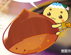
恵那市公式キャラクター「エーナ」

出発日 9/12(木)・17(火)・19(木)・23(月・祝)・26(木) 5回開催