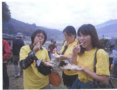
何を食べているのかな？