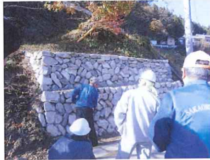
モデル石積みを使って講義