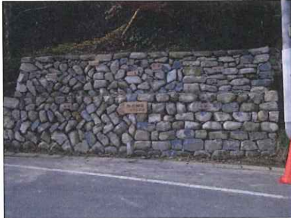
出来上がったモデル石積み

今回の石積み塾において、過去5回受講された方に『石積み技工士』を認定しました。また、石積み技法のモデル石積みを施行しました。場所は坂折棚田屋敷の隣り県道側のノリ面です。谷積み、布積み、乱積み、横積み、昔の谷積み、ハツ巻きなどの積み方が見られようになっています。