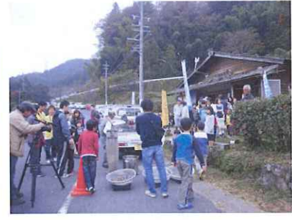
懐かしいポン菓子に興味しんしん