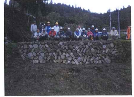
完成した石積みの上で記念写真