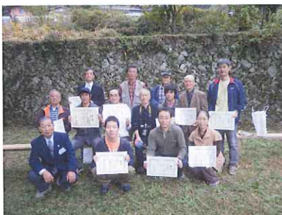
第5回坂折棚田フォトコンテスト入賞者

11月5日（土）にオーナーによる稲づくりの楽しみ、晴天に恵まれて収穫祭とフォトコンテストの表彰式が行われました。棚田汁、もちつき、芋もち、餅投げ、ポン菓子、赤飯を皆で食べて楽しい一日を過ごしました。