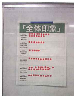
投票結果 坂折棚田は下から二段目

1月19日東京水道橋で、第6回東京棚田フェスティバルが行われ、今回初めてのイベントとして『おむすび合戦』がありました。さかおり棚田米（品種ミネアサヒ）を中野方町水道水で炊き上げ、上矢作のモンゴル塩でにぎった塩むすびが参加者の投票で最高点を取り、全体の印象賞というトップ賞を頂きました。