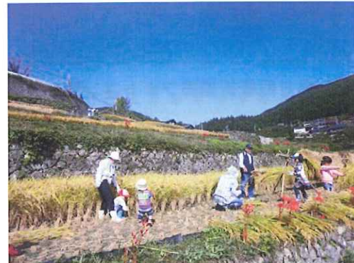
家族そろって稲刈り作業