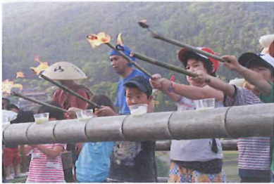
子どもたちによる点灯式

午後5時より、棚田広場での開会式(点灯式)で始まり、畦畔への点灯、めれた囃子の演奏、提灯行列へと続き、午後9時の終了時間まで、小さなお子さんからご高齢の方まで、いつもは静かな夜の坂折棚田が、大変賑わいました。