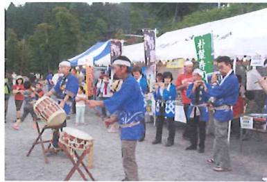
めれた囃子の演奏