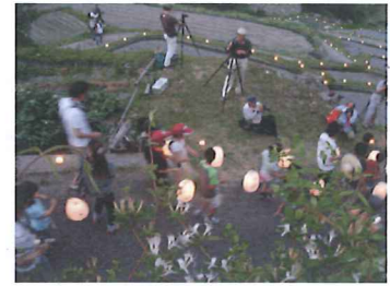
提灯行列のはじまり